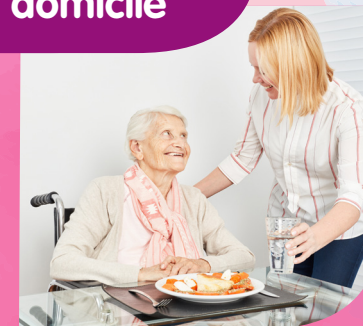
Portage de repas