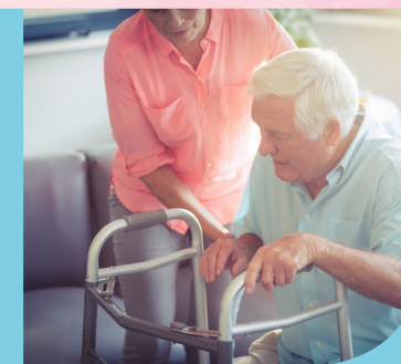
Soutien à domicile